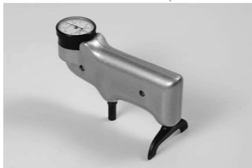
圖 1 934-1 型巴氏硬度計